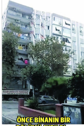
ÖNCE BİNANIN BİR BÖLÜMÜ AYRILDI...

Seferihisar açıklarında dün saat 14.51'de deprem meydana geldi. Depremün büyüklüğü ile ilgili 4 kurumdan farklı açıklamalar yapılması kafaları karıştırdı