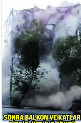
SONRA BALKON VE KATLAR BİRBİRİ ÜSTÜNE ÇÖKTÜ

Burası İzmir'in Bayraklı İlçesi. Depremün hemen ardından çekilen görüntü kan dondurdu. Bir bina yaklaşık 30 saniye süren depremin şiddetine dayanamadı. Binanın önce orta bölümü ayrıldı.