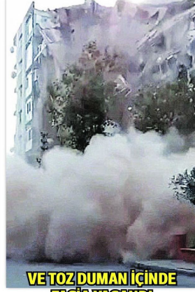
VE TOZ DUMAN İÇİNDE FAĞİA YAŞANDI

Daha sonra bina, üst üste dizilmiş iskambil kağıtlarının yıkılması gibi olduğu yere çöktü. O sırada park halindeki bir otomobil de enkaz altında kaldı. Bölgeden geçen insanlar can havlıyla kaçtı.