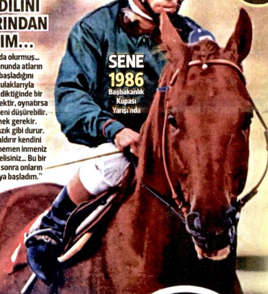
SENE 1986 Başbakanlık Kupası Yarışı'nda

Arada ufak kazalar da olmuştuk. Akdı, bu kazaların sonunda atların dilini konuşmaya başladığını anlatıyor: "Atlar kulaklarıyla konuşur. Kulaklarını diktiğinde bir şeyden korkmuş demektir, oynatırsa öncecek, dönerse seni dışlardır. Bunlara dikkat etmek gerekir. Bazi ata binersiniz kazık gibi durur. Seyisi de cekece kaldırı kendini yere vurur. O zaman hemen inmeniz lazım. Yürükken binmezsiniz. Bu bir deneyim. Bir zaman sonra onların psikolojisini anlamaya başladım."