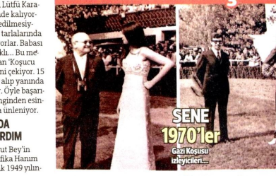
SENE 1970'ler Gazî Koşusu yarışçileri...