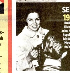
SENE 1971 Kraliçe II. Elizabeth adına Anadolu Kupası için Ankara Hipodromu'nda...