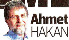
Ahmet HAKAN ahmethakan@hurriyet.com.tr

✓ Bu zamana kadar vatandaşın gündeminde sadece virüs vardı. Virüsten korunmaya dayalı sorular soruluyordu hep. Soruların muhatapları ise bilim insanlarıydı. Artık bu gündem, biraz geride kaldı.