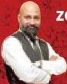
HABER SONER KAN

Pankreas kanseri nedeniyle 65 yaşında hayatını kaybeden, Türk Sanat Müziği sanatçısı Faruk Tınaz, memleketi Adana'da son yolculuğuna uğurlandı. Tınaz'ın eşi Canan Tınaz, eşinin ölümünün bir 'doktor ihmali' olduğu iddiasını yeniledi. Faruk Tınaz'ın cenazesinde kadın ve erkekler birlikte saf tuttu. Tınaz, kendisi gibi yine kanser nedeniyle 13 yıl önce ölen babası Ferit Tınaz ile aynı gün yine aynı aile kabristanında toprağa verildi. ■ 3'te