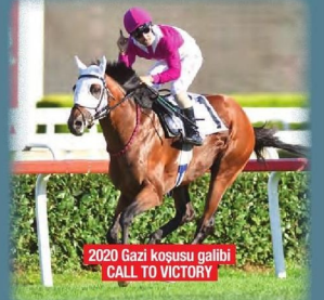
2020 Gazi Koşusu galibi CALL TO VICTORY

95. Gazi Koşusuna iki Adanalı yetiştiricilik primi de dahil olacak ve ödül 3.737.850 TL'ye ulaşacak. 95. Gazi Koşusuna iki Adanalı yetiştiricilik primi de dahil olacak ve ödül 3.737.850 TL'ye ulaşacak. 95. Gazi Koşusuna iki Adanalı yetiştiricilik primi de dahil olacak ve ödül 3.737.850 TL'ye ulaşacak.