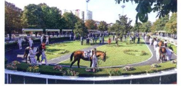
2000 yılı Gazi Koşusu'ndan bir geçit...