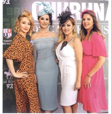
Türkiye'nin Ascot'unda şapkalar da yarışıyor