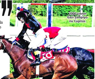
2000 yılının Gazi şampiyonu Caprice.

YAKLAŞIK 20 bin yarışta at bindim. İlk yarışında büyük şanssızlık yaşadım. Attan düştim ve yarış bitirmedim. Tabii yılmadan çalıştım. Mesleğimi de sevince, başarı kaçılmaz oldu. Diğer de İzmir'de açık yarış koşuyordum. Plase bir ata biniyordum, starta giderken at beni düşürüp yavaş tempoda bir tur attı. Eskiden getirip koşuyorlardı, şimdi yarış mesafesi kadar koşarsa yarıştan çıkıyor. At nefes nefese geldi. Yarış başladı her yerde dolu gidiyor. İnanılmaz dedim. Şunu düşünürüm; bu at kaçtı çok iyi oldu. O yarışta kazandım, tuhaftan benim için.