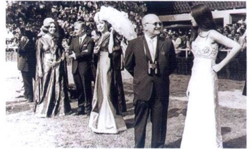
1970 yılı Gazi Koşusu'ndan bir kare