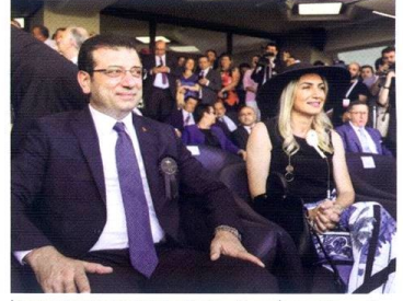
Istanbul Büyükşehir Belediye Başkanı Ekrem İmamoğlu ve eşi Dilek İmamoğlu, 2019 yılı Gazi Koşusu'nda

95. Gazi Koşusu'nu kazanan tayın sahibi birincilik ikramiyesine ek olarak kayıt tutarları, taksit ücretleri ve at sahibi primiyle birlikte toplam 3.134.100 TL'lik bir ikramiyeye kazanmış olacak. At sahibi aynı zamanda tayın yetiştiricisi ise bu tutara yetiştiricilik primi de dahil olacak ve ödül 3.737.850 TL'ye ulaşacak.