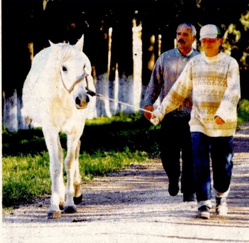
This file photo shows two grooms walking a horse at a stud farm in the northwestern province of Bursa's Karacabey district.