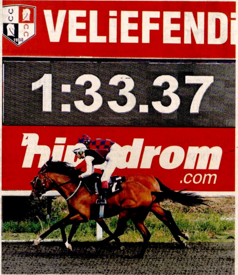
Horse owners earn income from the prize money awarded in the races in which their horses participate.

The value of a horse varies greatly depending on its ped-