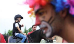
Elazığ'da yaşayan Ahıska Türkü çocuklar önce at bindi, ardından doyusıya eğlendi.