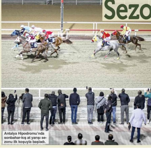
Antalya Hipodromu'nda sonbahar-kış at yarışları sezonu ilk koşuyla başladı.