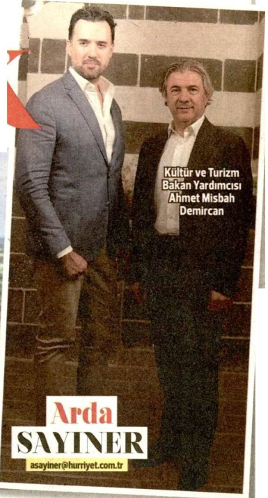
Kültür ve Turizm Bakan Yardımcısı Ahmet Misbah Demircan

Festival 20 yıldır süregelen Diyarbakır surlarının restorasyonunun adeta kutlaması gibi bayram havasında geçiyor."