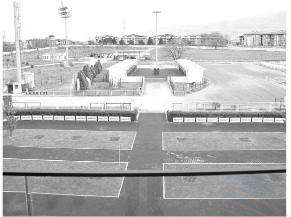
Yarışa girecek olan atlar burada turlayacak ve ardından yarışa girecek.