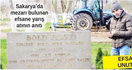
Sakarya'da mezarı bulunan efsane yarış atının anıtı

Sözün özü şu... Sağlık Bakanı ile Nihat Özdemir ve heyeti gerçek sorumluluktan kaçmayı uygun bulup, bu konuda şimdilik sınıfta kaldılar. Bakalım, yaz dönemindeki yeni sınavda sınıfta çakılan dersleri verip, sınıf atlayabilecekler mi?