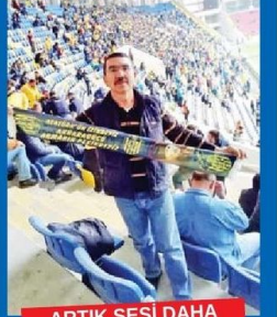
ARTIK SESİ DAHA GÜR ÇIKACAK