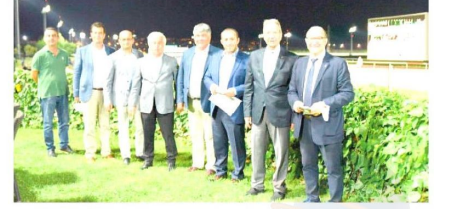
▼ Kocaeli Sanayi Odası 2021 Yılı Koşusu, Kocaeli Kartepe Hipodromu'nda gerçekleştirildi. Yarışı KSO'lu yöneticiler de izledi.